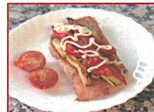
Tosta de la tierra con salsa de yogur