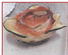
Flor de salmón y calabacín