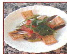
Matrimonio a la mexicana