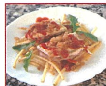
Zarzilla con salsa de pimientos