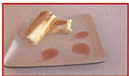
Rollito de carne con salsa de cerezas