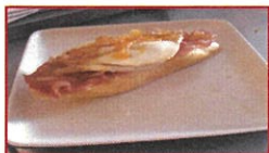
Tosta de bacon con queso de cabra caramelizado